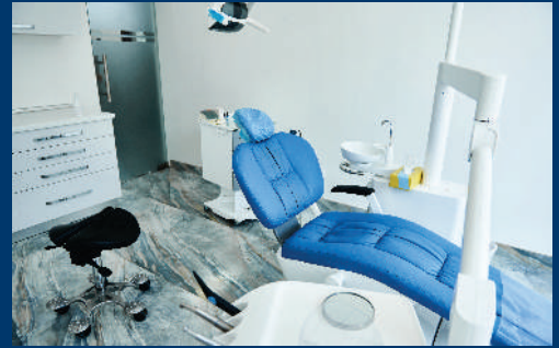
Clínicas de especialidades