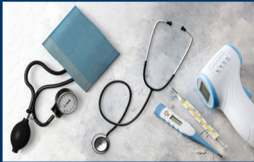
Artículos no críticos