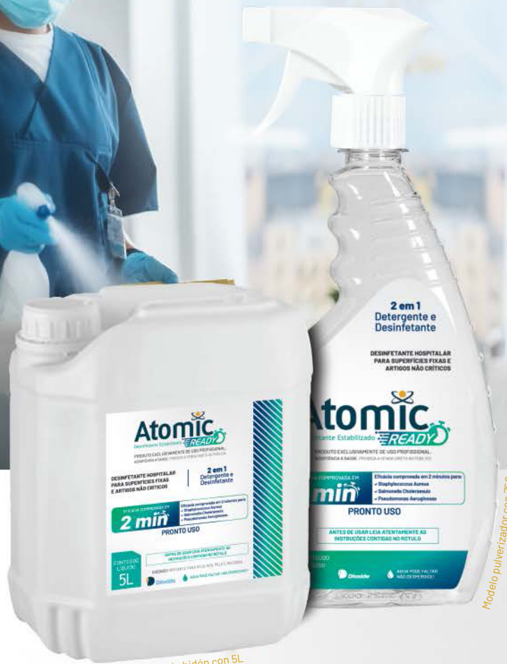
Modelo pulverizador con 750ml